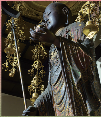
放生院 重文 地藏菩薩立像