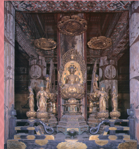
東寺 国宝 五重塔 初層内陣