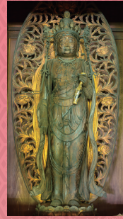
恵心院 十一面観音菩薩像