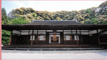
龍吟庵 国宝 方丈