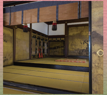
知恩院 重文 大方丈上段の間