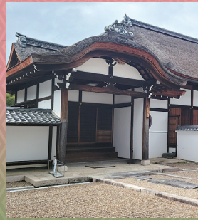
萬福寺 重文 松隠堂