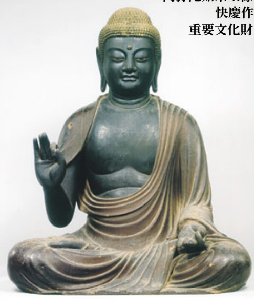
阿弥陀如来坐像 快慶作 重要文化財