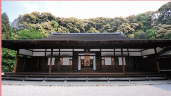
龍吟庵 国宝 方丈