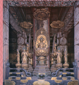
東寺 国宝 五重塔 初層内陣