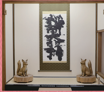
伏見稲荷大社 棟方志功画伯「稲荷大明神」