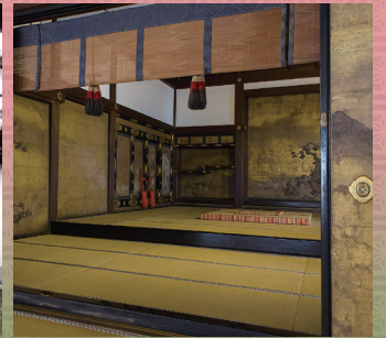
知恩院 重文 大方丈上段の間