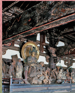
東福寺 国宝 三門 二層内陣