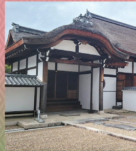
萬福寺 重文 松隠堂