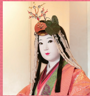
伝統文化保存協会 斎王代十二単装束