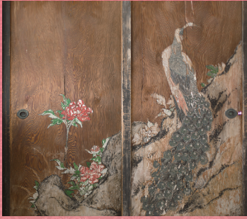
興聖寺 伏見城遺構の杉戸絵