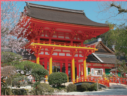
上賀茂神社 重文 楼門