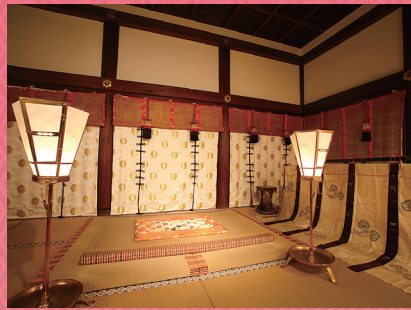
下鴨神社 重文 神殿「開かずの間」