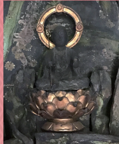
廬山寺 明僧光秀公念持仏 地藏菩薩像