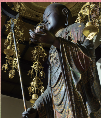
放生院 重文 地藏菩薩立像